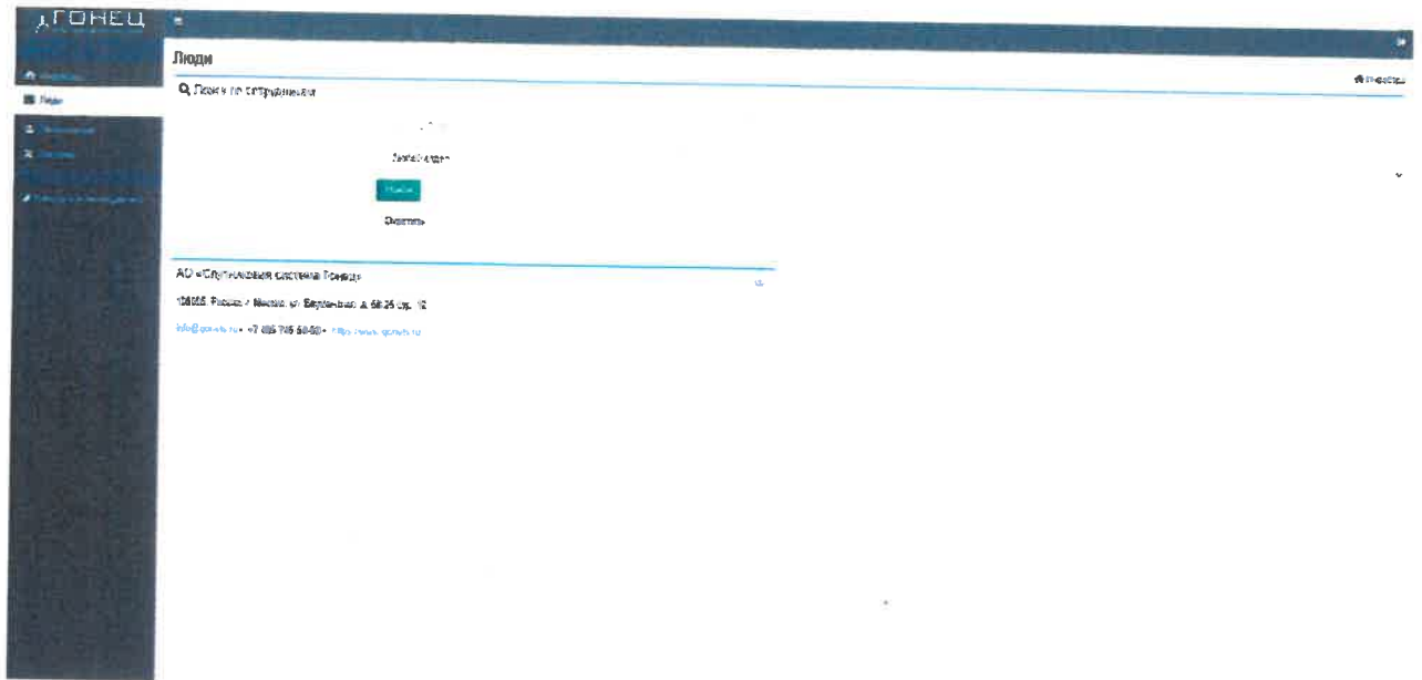
Рисунок 3 – «Люди».

3.2.2. При переходе в раздел «Люди» отобразиться справочник сотрудников АО «СС «Гонец» (Рисунок 3).